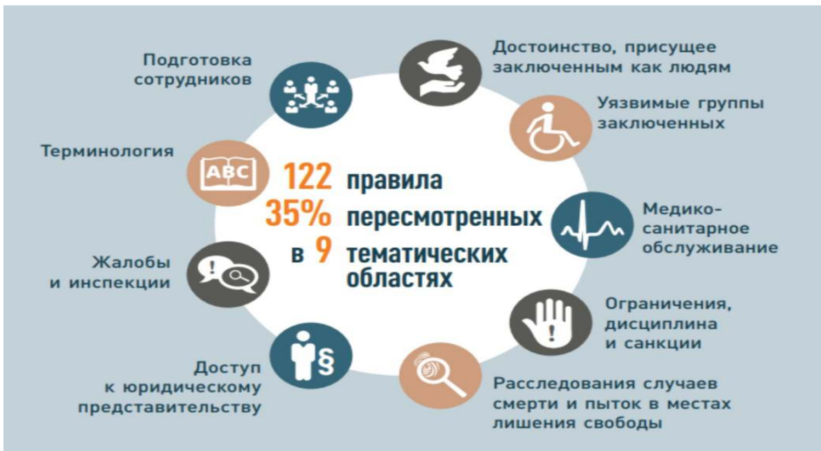
Рис. Тематические разделы Правил Нельсона Манделы.

Остановимся на отдельных правилах, которые могут способствовать дерадикализации осужденных за преступления террористического характера и экстремистской направленности.