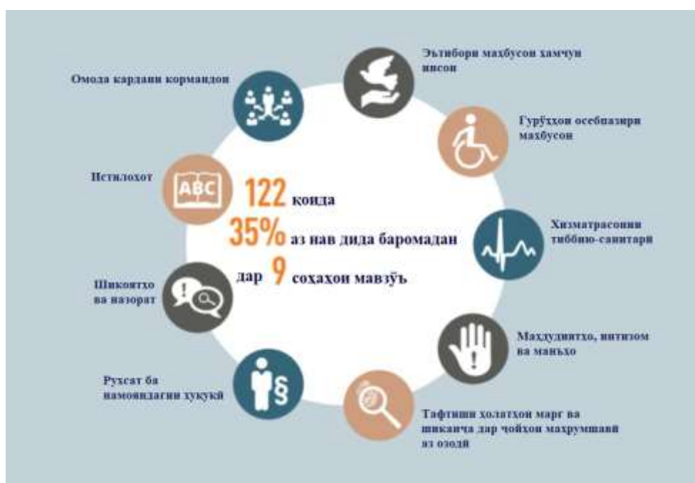
Расми 1. Қисмҳои мавзӯи қоидаҳои Нелсон Мандела.

Дар саҳ. 88-и Қоидаҳои Нелсон Мандела, функсияҳои корманди иҷтимоӣ дар муассисаи ислоҳӣ дида мебароянд: